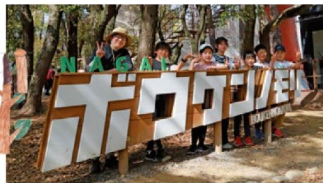
ポウケンノモリNAGAIの看板がお出迎え!楽しい思い出を記念に残せる撮影スポットも。街のすぐそこにある冒険をぜひ体験してみてくださいね。

公園が多い東住吉区の中でも一番有名な長居公園。大きさは66.3haとUSJより大きい!家族で楽しめるスポットも多く、イベントにスポーツに大満喫できます!