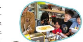
ファラフェル料理めっちゃおいしい!