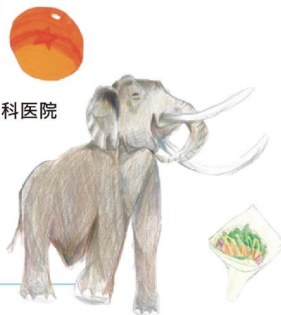
イラスト/じん、なつき、まいりょうた