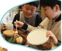
子ども記者のコメント