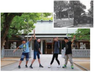
影山さんがよく遊んだ山阪神社にも取材に行きました！右上は影山さんが小学生だった1970年頃の写真。山阪神社の事は85年の「三代実録」に書かれているそう！一度災害で燃えてしまいましたが再建しました。

— 東住吉でよく行った食べ物やさんとかありますか？ 学校の帰りに友達とお好み焼き屋によく行ってたね。メニューが1個しか無くて払った金額で大きさが変わるっていう。