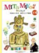
東京都文京区 「MITAMIYO!!」 VOL.04