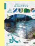
長野県安曇野市 「AZUMO」 VOL.01

創刊号の発刊を目指して、進行中エリア! 静岡県富士市、神奈川県鎌倉市、大阪市南部 など