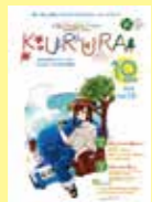
静岡県伊豆市 「KURURA」 VOL.10