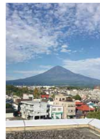
カッコイイ外観(写真上) 5階のテラスからの富士山はとてもキレイ(写真下)

建物について 富士山世界遺産センターの建物には富士ヒノキが使われています。坂(ばん)さんという人が設計してくれたと館長さんは話してくれました。それと、5階ホールにある逆さ富士のカタチをしたイスも坂さんが設計されたそうです。