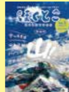
山梨県北杜市 「ほくとこ」 VOL.03