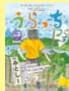
静岡県沼津市 「うらっち」 VOL.03