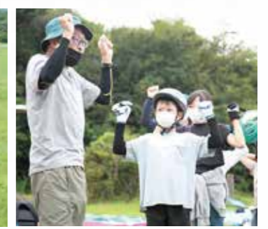
飛ぶ前に飛び方を教えてください。