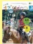
静岡県伊豆の国市 「IZUCCO」 VOL.03