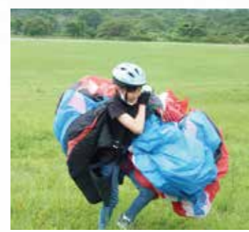
終わったら、自分で運び次の人へ。

まず、おしりマット（ハーネスという体とパラグライダーをつなぐ道具）を背負います。準備をし、走るときは前を向いてリラックスすることが大切です。走っていて飛びそうになったら、まだ走り続けます。そうすると、まだ走り続けます。着ているものが重くて大変だけれど、がんばって走り続けると飛び始めます。 むずかしいところは、浮き始めてもまだ地に足がついている間は走っていないといけないところです。最後に腕を下げるのも力があるから大変です。どんだん腕を下げていたら地上に着きます。 考えすぎるとこわくなるから、なるべく考えずに飛ぶと良いです。風があつたほうがよく飛びます。